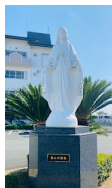
正門の「恵みの聖母」