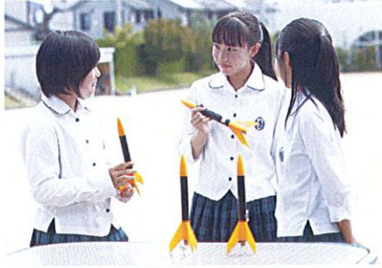
<夏休み期間中も改良を重ね...>