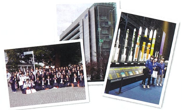
※社会情勢により、変更の可能性があります