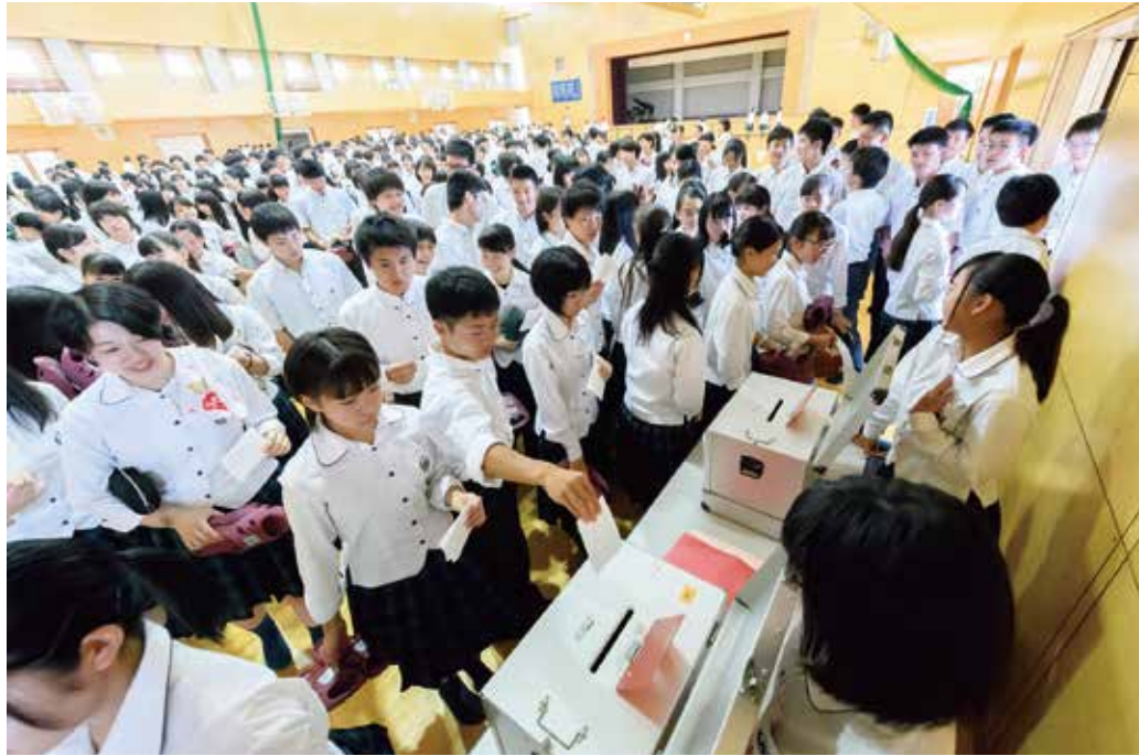
生徒会選挙は大いに盛り上がり、投票箱の前には長蛇の列。